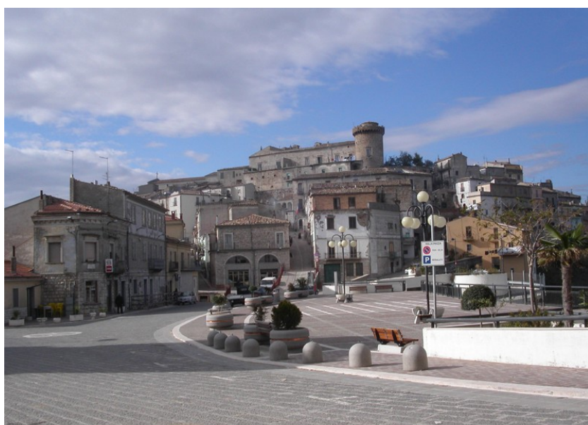
Celenza Valfortore - Piazza Malice e centro storico

"Molitoria" nel 1955 e ad altre attività imprenditoriali, costituirono un periodo di benessere sociale durato fino alla fine degli anni '70 inizi anni '80, quando, inesorabilmente, una dopo l'altra hanno cessato le attività, per ultima nel 2000-2001 l'industria Molitoria, lasciando in evidente il disagio economico l'intera popolazione. Presto è iniziato da parte dei giovani l'esodo dal paese, tanto che dalle 950 famiglie e 3500 abitanti nel 1964, si è arrivati, nel 2009 a solo 1802 abitanti.