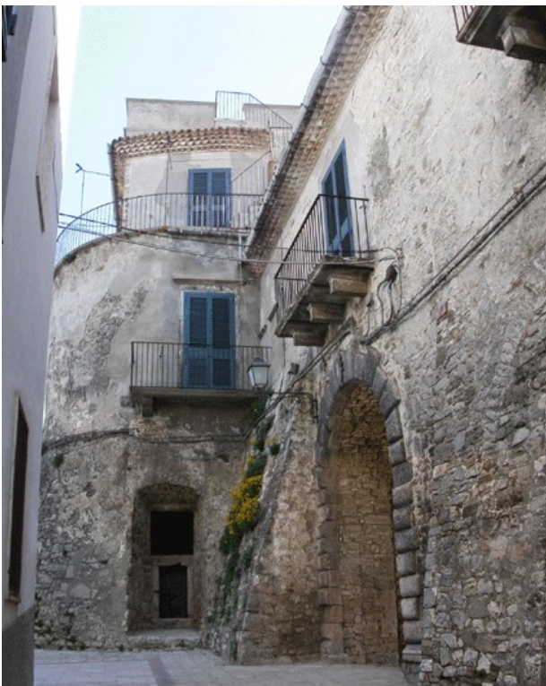
La torre distrutta dall'incendio del 1799 con annesso carcere.