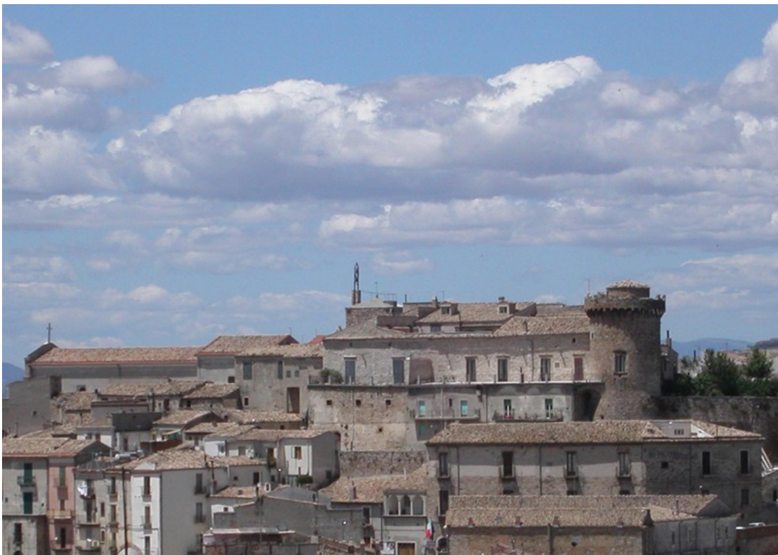
Celenza Valfortore - Palazzo baronale dei Gambacorta (Sec. XVI)

Con il periodo svevo inizia la lunga serie dei feudatari che detengono il feudo di Celenza fino all'avvento della Repubblica Partenopea: