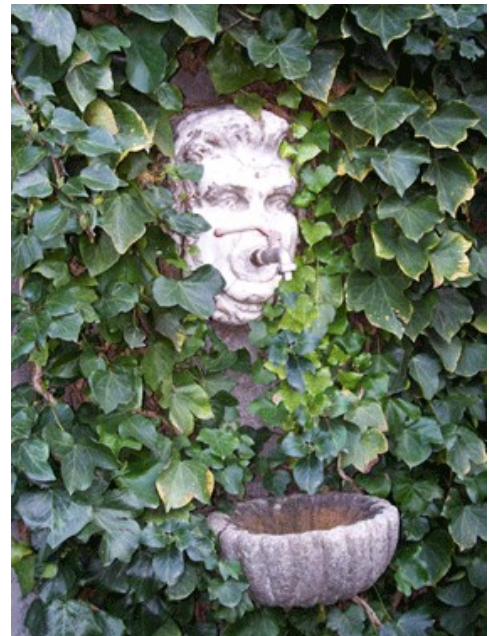
Testa in marmo raffigurante uno dei Marchesi Gambacorta, ora murata in giardino come fontana

Da una Supplica di Gaetano Mazzaccara al Re Ferdinando IV del 1759 abbiamo la conferma che il palazzo aveva due torri ed era fornito di tre logge.