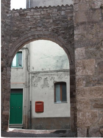
Porta S. Nicolò