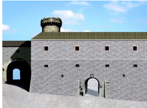
Ricostruzione aspetto del Palazzo Baronale, visto da Via Colombo