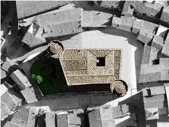
Ieri e ...