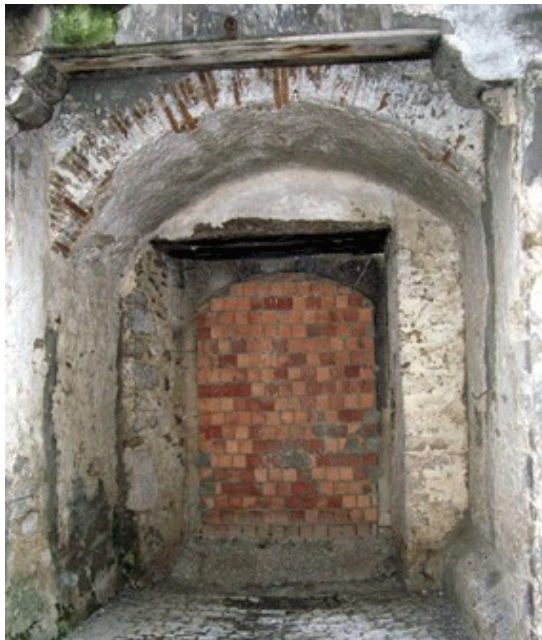
Ingresso al castello murato