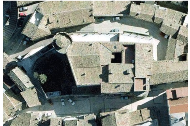
.. oggi .

Il Castello presenta la classica posizione topografica: è ubicato al centro del tipico rione medioevale da cui si dipanano i vicoli, lungo i quali si sviluppa la parte feudale del paese con case arroccate l'una all'altra;